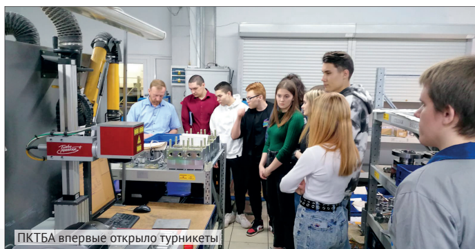
ПКТБА впервые открыло турникеты