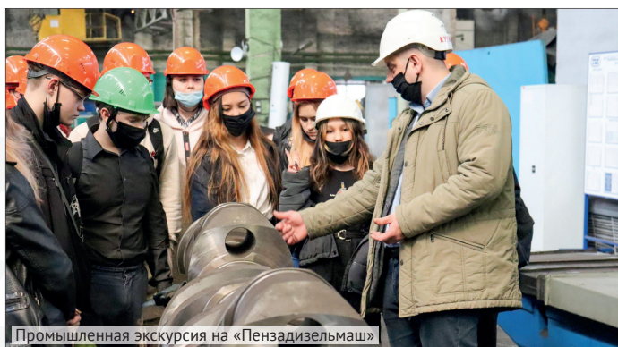
Промышленная экскурсия на «Пензадизельмаш»

В апреле стартовала Всероссийская профориентационная акция Союза машиностроителей России «Неделя без турникетов». Расскажем, как это было почти на каждом пензенском предприятии.