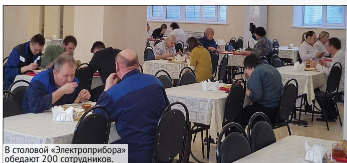
В столовой «Электроприбора» обедают 200 сотрудников.

«Шашлык из куриной грудки, салат из свеклы с сыром, уха, пирожок со сгущенкой...».