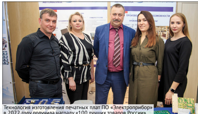
Технология изготовления печатных плат ПО «Электроприбор» в 2022 году получила награду «100 лучших товаров России».