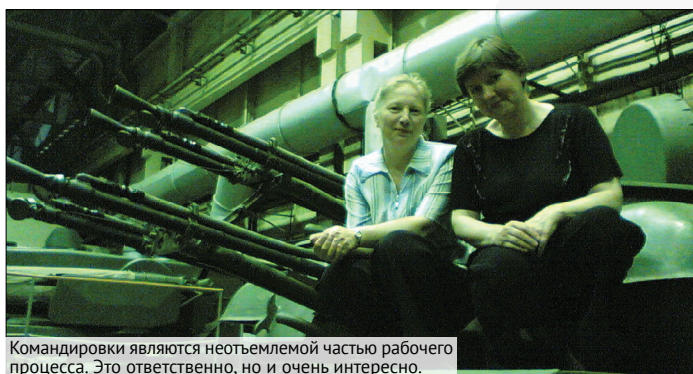
Командировки являются неотъемлемой частью рабочего процесса. Это ответственно, но и очень интересно.