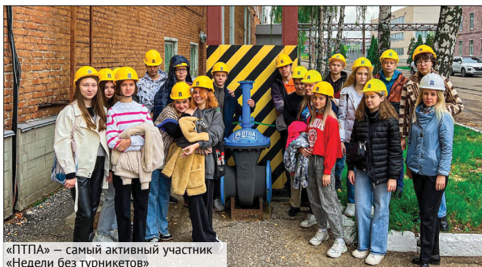
«ПТПА» — самый активный участник «Недели без турникетов»

«Неделя без турникетов» вернулась к формату живого общения и экскурсий