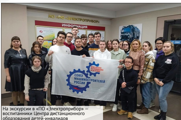
На экскурсии в «ПО «Электроприбор» — воспитанники Центра дистанционного образования детей-инвалидов

ентационные встречи на достойном уровне.