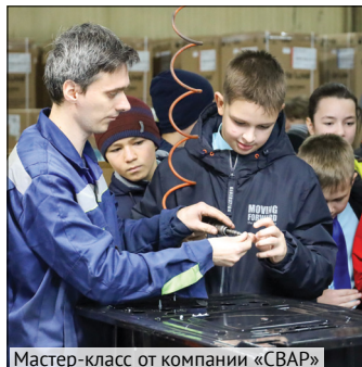
Мастер-класс от компании «СВАР»

В Пензенской области в акции приняли участие около 4,5 тысяч обучающихся, они посетили производственные площадки предприятий. По